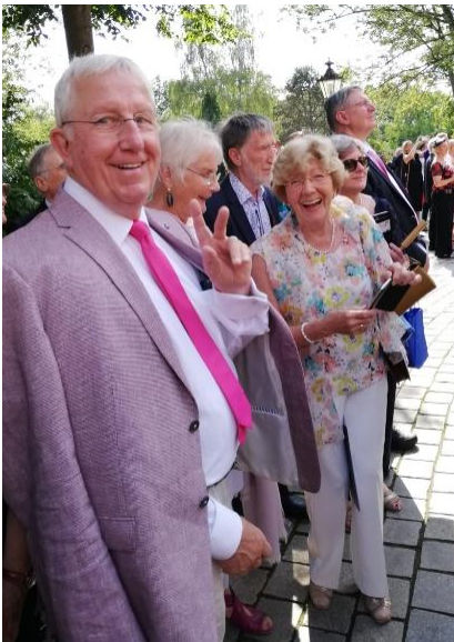
Dank der Großzügigkeit eines Freundes erlebten wir im Festspielhaus Bayreuth Richard Wagners Tannhäuser.

Rechts Tannhäuser als Clown unterwegs mit Venus.