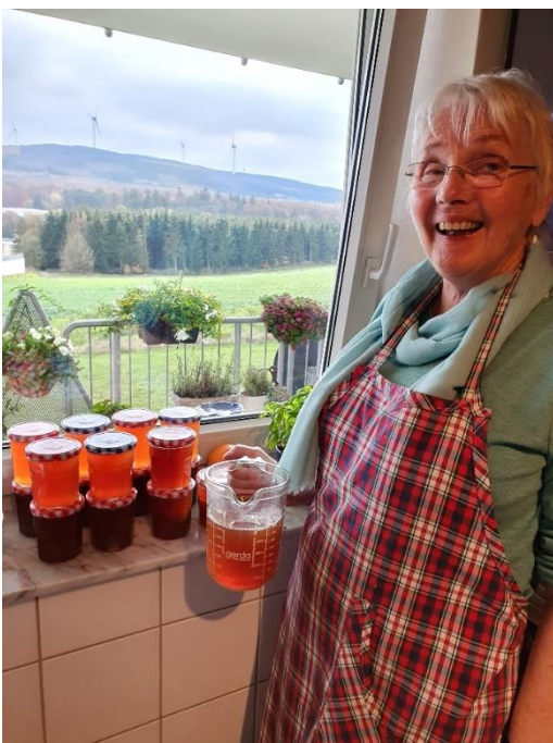
Annette freut sich über eine gelungene Premiere: Quitten-Gelee.

Allen, die diesen Brief lesen, wünschen wir Freude am Leben, Zusammensein mit lieben Menschen und Zuversicht auch im kommenden Jahr