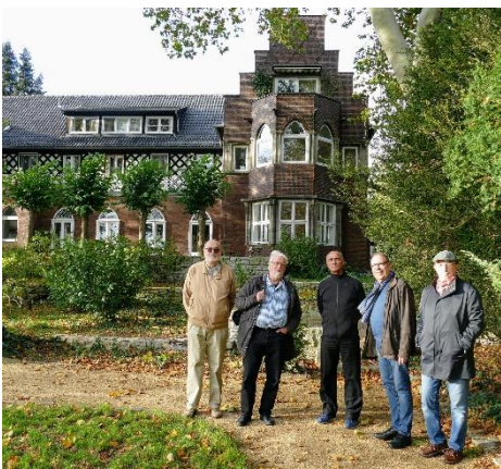
In Berlin-Kladow trafen sich ehemalige SJ-Novizen.