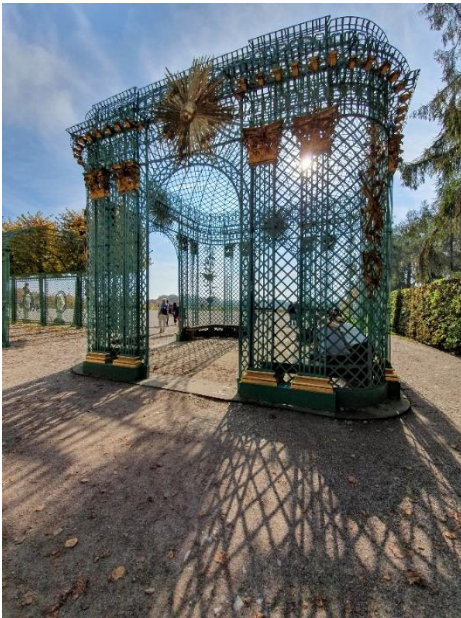
Berlin haben wir im Oktober genossen: den Park von Sanssouci wie den Potsdamer Platz.