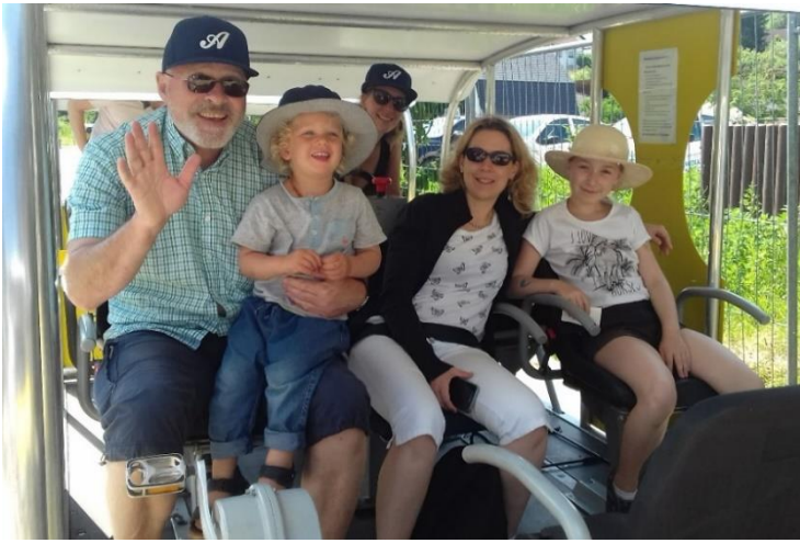
Sommerliches Verwandtentreffen in Heppenheim an der Bergstraße inklusive Draisinenfahrt durch einen alten Eisenbahntunnel.