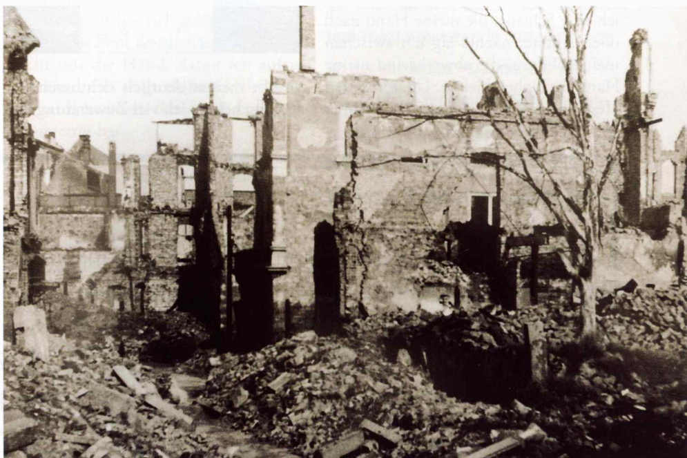
Blick in Kiesstraße in die wir geflüchtet waren nach Kriegsende

Jetzt standen wir nur mit dem, was wir auf dem Leib trugen, und dem kleinen weinroten Koffer am Bahnhof in Lengfeld. Wir waren auf die Solidarität der in Hering wohnenden Familie meines Vaters angewiesen. Und sie wurde uns von Anfang an zuteil. Im Haus ➤