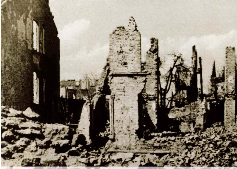
Bilder unseres Weges ins Krankenhaus