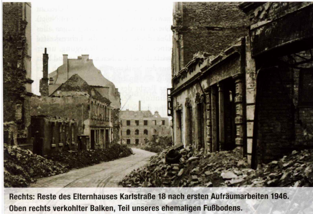
Rechts: Reste des Elternhauses Karlstraße 18 nach ersten Aufräumarbeiten 1946. Oben rechts verkohlter Balken, Teil unseres ehemaligen Fußbodens.